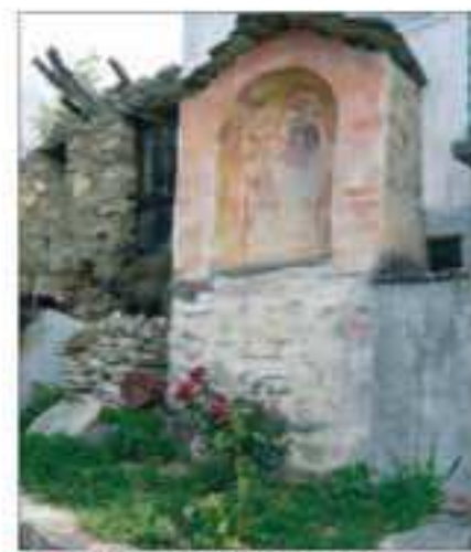
5 Località: B ta Civalleri, sentiero per Crosa Pittore, anno: Nessun riferimento leggibile Santi Rappresentati: Madonna con bambino.