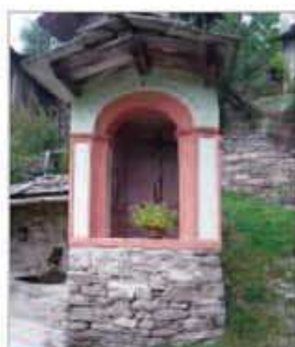
26 Località: B ta Durandi, sentiero per Civalleri. Pittore, anno: Gauteri, 1843 Santi Rappresentati: Crocifisso.