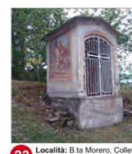
23 Località: B ta Morero, Colletto di Morero Pittore, anno: Eretto nel 1774, ricostruito nel 1948, F. Agnesotti. Santi Rappresentati: Gesù, Giuseppe e Maria. A lato: S. Simone, S. Bernardo.