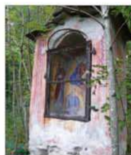
29 Località: Sentiero Durandi-Sampeyre, by per Stentivi (sotto Tueila). Pittore, anno: Nessun riferimento leggibile Santi Rappresentati: Madonna con bambino.