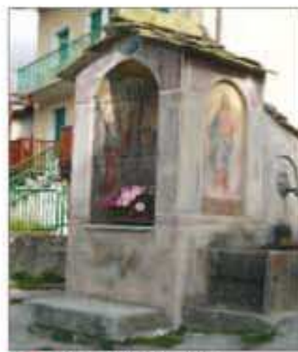
2 Località: B ta Valla, Pione-fontana Pittore, anno: 1940 Santi Rappresentati: Regina Pacis.