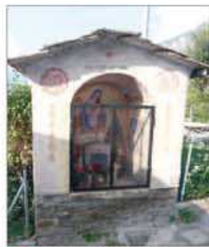
4 Località: B ta Civalleri, sentiero per Sampeyre Pittore, anno: Gauteri, 1866 Santi Rappresentati: Mater Amabilis, S. Giuseppe, S. Joffredo.