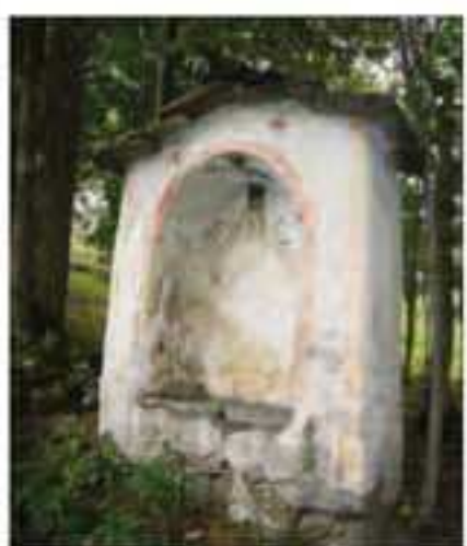
12 Località: B ta Serre, sentiero per Serre Inferiore. Pittore, anno: 1840 Santi Rappresentati: Santo trafitto da spade