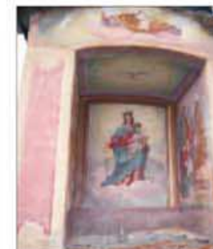
21 Località: Borgata Para, rotonda stradale. Pittore, anno: Nessun riferimento Santi Rappresentati: Maria Ausiliatrice. A lato: S. Giuseppe, S. Giovanni, S. Antonio, S. Maria Maddalena, S. Giacomo, S. Domenico, S. Chiaffredo.