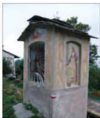
19 Località: Dragoniere, by strada Co' di Para. Pittore, anno: Nessun riferimento Santi Rappresentati: Maria Ausiliatrice, a lato Gesù falegname.