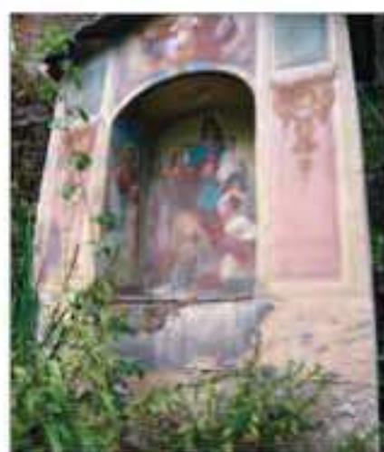
13 Località: B ta Serre, sentiero per Dragoniere. Pittore, anno: 1934 Santi Rappresentati: Madonna.