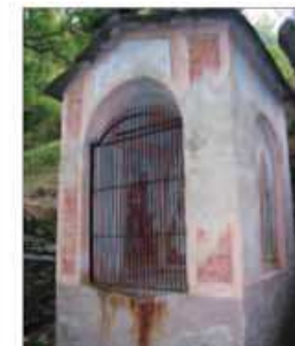
22 Località: B ta Para, sentiero per Grapun di Rore. Pittore, anno: Testa, 1925 Santi Rappresentati: Madre di Misericordia. A lato: S. Giovanni Battista, S. Chiaffredo.