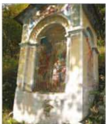
10 Località: Sentiero per Serre. Pittore, anno: Agnesotti, 1936 Santi Rappresentati: Madonna con bambino, a lato: S. Giacomo, S. Maria Maddalena.