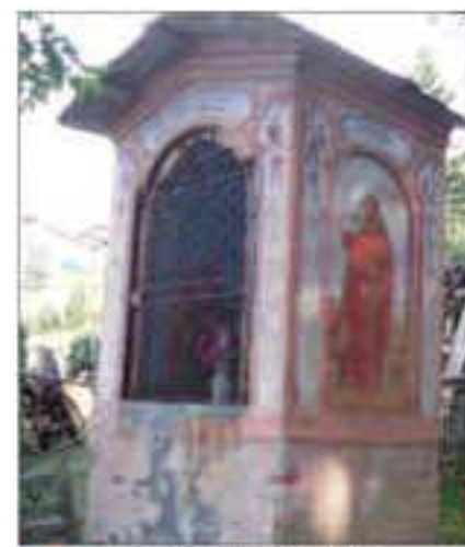
6 Località: B ta Civalleri, sentiero per Becetto. Pittore, anno: 1909 Ex voto abitanti Santi Rappresentati: Gesù, Giuseppe e Maria.