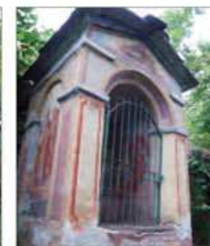
17 Località: Sentiero per Dragoniere, prossimità cimitero. Pittore, anno: Agnesotti, 1929 Santi Rappresentati: Madonna con bambino.