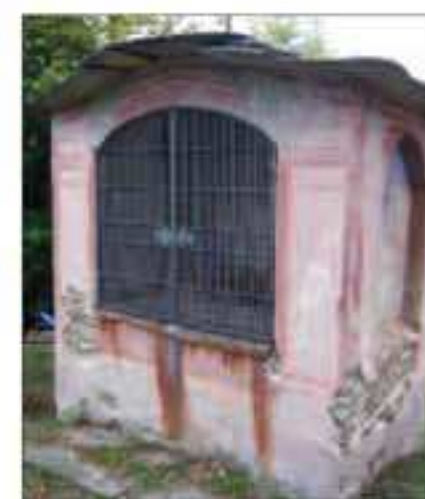
15 Località: Percorso culturale. Pittore, anno: Nessun riferimento Santi Rappresentati: Gesù, Giuseppe e Maria.