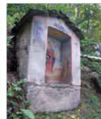
16 Località: Barmasso, sentiero per Dragoniere. Pittore, anno: 1911 Santi Rappresentati: Madonna, a lato: S. Simone, S. Bernardo.