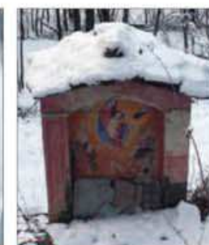
32 Località: Strada Stentivi. Pittore, anno: Nessun riferimento leggibile. Santi Rappresentati: Madonna con bambino.