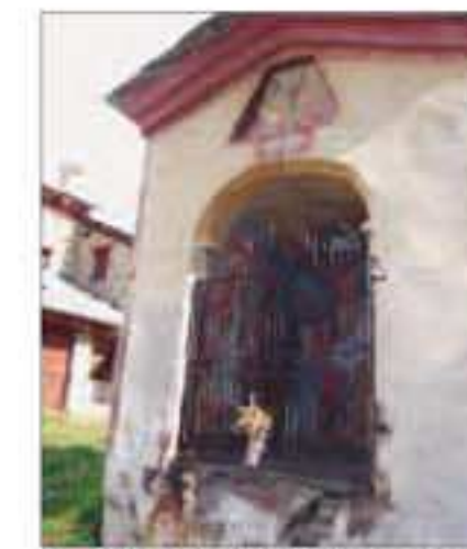
8 Località: Meire Ruá, centro borgata Pittore, anno: Riferimenti non leggibili Santi Rappresentati: Crocifissione, a lato: S. Margherita, S. Anna, S. Caterina, S. Giovanni, S. Giacomo, S. Giuseppe.