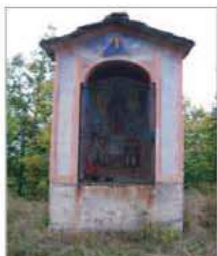
20 Località: Dragoniere, by sentiero Vallone - Rore. Pittore, anno: Testa, 1927 Santi Rappresentati: Madre di Misericordia.