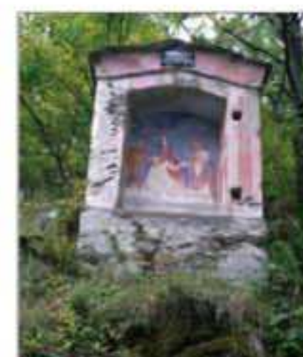
30 Località: Sentiero Stentivi-Sampeyre Pittore, anno: Nessun riferimento leggibile Santi Rappresentati: Deposizione di Cristo.