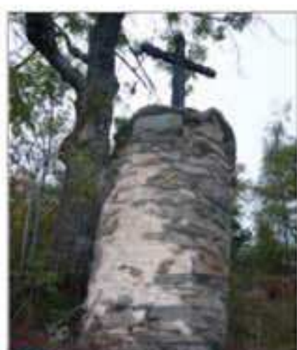
24 Località: Sentiero Becetto-Morero, prossimità Vir d'ia Gaido Particolari: Pilun Rutund: Pione a torre, sostegno di una croce.