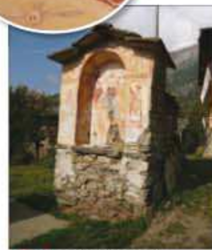
7 Località: B ta Morelli, centro abitato Pittore, anno: 1770 Ultime cifre non leggibili Santi Rappresentati: Incoronazione.