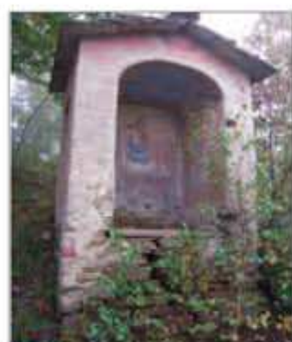
25 Località: Forti di Durandi, B ta Durandi. Pittore, anno: Nessun riferimento leggibile. Santi Rappresentati: Madonna con bambino.