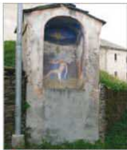
1 Località: B ta Paschero, prossimità vecchio cimitero Pittore, anno: Nessun riferimento leggibile Santi Rappresentati: Deposizione dalla croce.