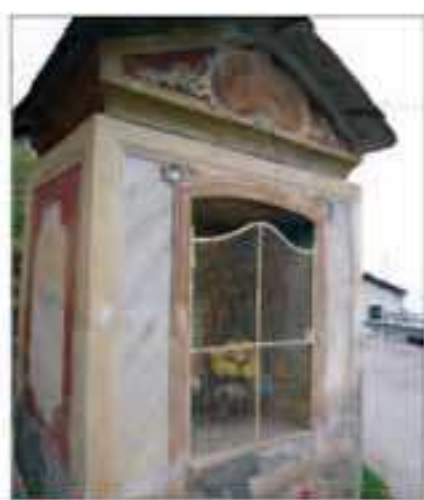
18 Località: Dragoniere, Co' di Serre. Pittore, anno: Nessun riferimento leggibile Santi Rappresentati: Madonna del Rosario.